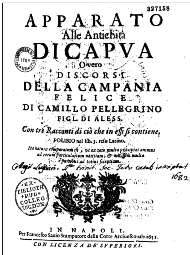
Figura 2. C. Pellegrino, Apparato alle antichità di Capua

Sui rapporti e sulle corrispondenze tra l' Apparato alle Antichità di Capua e il Campanien si è invece focalizzata l'attenzione di Claudio Ferone, il quale ha dimostrato come Beloch abbia ricavato dallo scritto di Pellegrino la griglia concettuale entro cui dare una precisa e compiuta organizzazione alla materia trattata nella propria opera 12 .